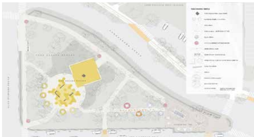
Idejno rješenje uređenja Parka Oscara Nemona, autori: Juraj Kopač, Bogdan Paulik i Iva Dujmić, BP Consulting d.o.o., 2024.