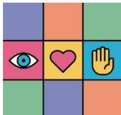
Logotip projekta Eyes Hearts Hands Urban Revolution (EHHUR)

Uz tri nove europske vrijednosti (održivost, uključivost i estetika) NEB insistira i na trima novim radnim principima: proces rada mora biti participativan (konzultiranje, surazvijanje, samoupravljanje), mora se ostvariti povezanost na više razina (od lokalne do globalne), a proces rada mora biti transdisciplinarni (multidisciplinarni, interdisciplinarni i izvan-disciplinarni).