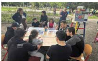
Radionica "Što želite u Parku Oscara Nemona?"

Projektni zadatak: manje intervencije u preoblikovanje parka primjenom motiva trokuta i srca, sadnja novog visokog i niskog zelenila, znatnije intervencije u parteru projektiranjem novih pješačkih staza kako bi se park integrirao u obodne pješačke staze, postavljanje paviljona i sličnih elementa urbane opreme s digitalnim informacijama o životu i djelu osječkoga kipara Oscara Nemona, educiranje o različitosti vjera i kultura.