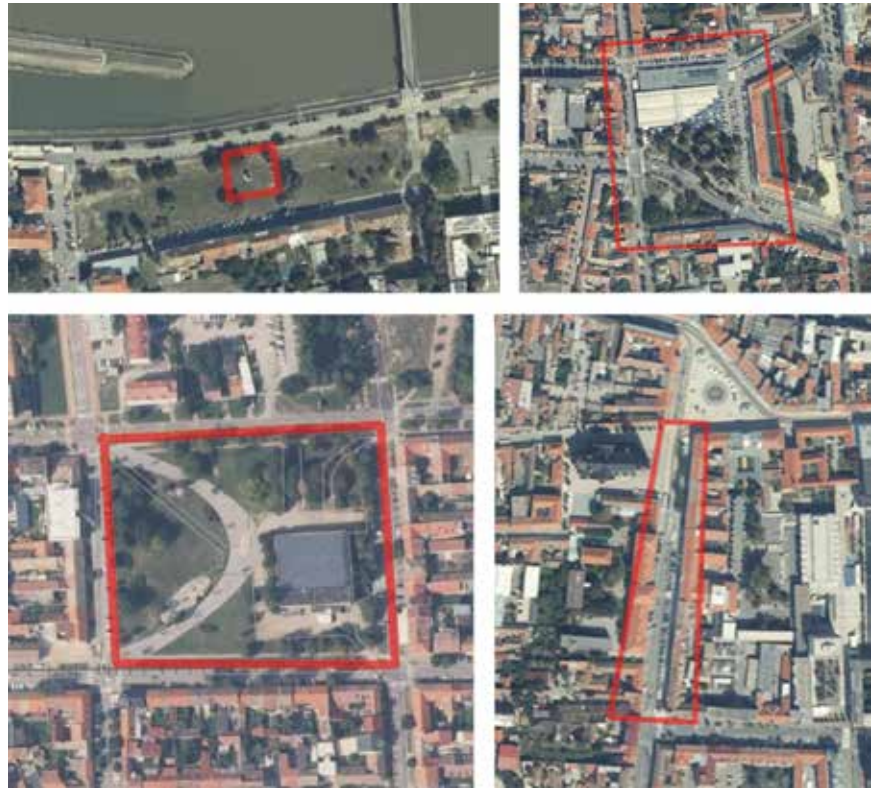
Četiri osječke lokacije – javni parkovi i Županijska ulica

Ideja: glavni motiv su oči koje simboliziraju horizont, rijeku Dravu (vodu) kao stoljetnu obzornicu Osijeka, vidljivost; rijeka kao spajanje kultura i suživot uz rijeku (vodu); oči koje gledaju u budućnost; oči su različite boje pa prostor komunicira ideju boja (ideju vizualnog) izvorne škole Bauhaus te Otti Berger (studentice i nastavnice na izvornome Bauhausu) i Andora Weininger (konceptualnog umjetnika na izvornome Bauhausu)