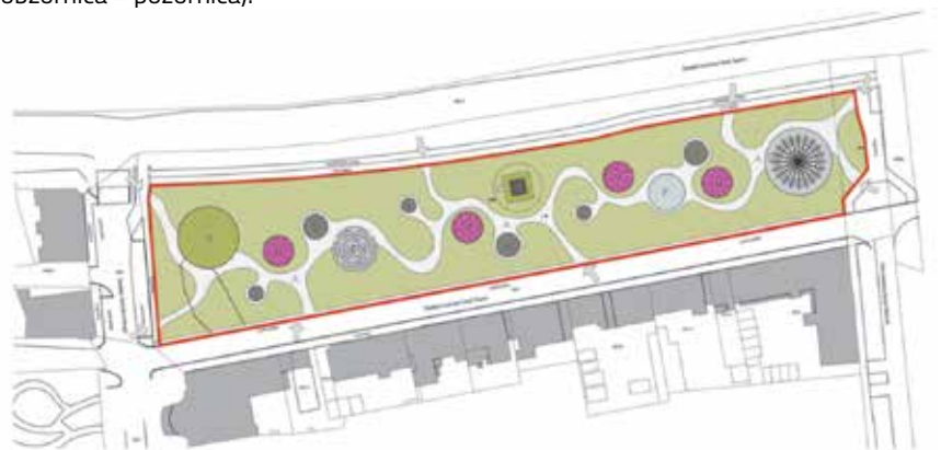
Idejno rješenje parka oko zdenca, autori: Bruno Rechner, Senka Šepić, Rechner d.o.o. Osijek, 2023. i 2024.