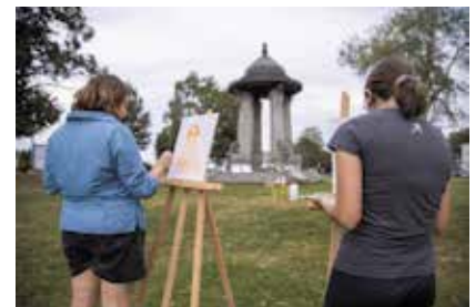
Radionica "Što želite u parku oko zdenca?"

Projektni zadatak : kreiranje suvremenog parka primjenom motiva krugova, obnova povijesnog zdenca, sadnja različitih vrsta zelenila koje kroz godinu mijenjaju boje, postavljanje interaktivnih edukativnih digitalnih panela koji posjetitelje informiraju o Osijeku, Dravi, Otti Berger i Andoru Weiningeru, korištenje raznobojnih tkanja Otti Berger kao oblikovni motiv, postavljanje makete zamišljenoga kružnog kazališta Andora Weininger (obzornica = pozornica).