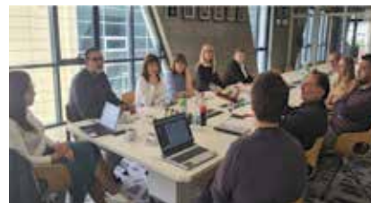
Sastanak projektnog tima u vezi uređenja parka Zrinjevac

volumena, rekonstrukcija dvorane i parka treba činiti jedinstvenu i jednostavnu funkcionalnu i oblikovnu cjelinu; sadnja dodatnog visokog i niskog zelenila, pogotovo u istočnome dijelu parka; predvidjeti interaktivno igralište u kojemu je fokus na e-mobilnosti te zelenoj kreativnosti i e-kreativnosti.