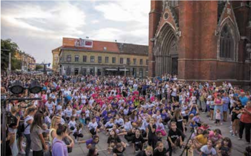
Radionica "Što želite u Županijskoj ulici?"